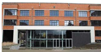
Campus Blairon Gebouw Europeion Steenweg op Gierle 100 B-2300 Turnhout